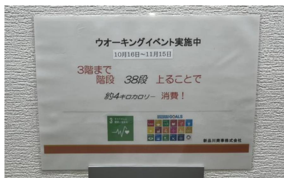
階段の利用を奨励するポスター

すべての事業場において、全社員が、始業時にラジオ体操を実施しています。始業開始後に業務として行うことで、電話対応等で参加できない社員を除いて、全社員が取り組むようになりました。